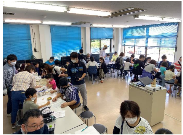
写真 1. 第3回親子自然探訪教室「不思議なキノコを探しにいこう！」の様子. 左：山の中でのキノコ採集. 右：室内での分類作業