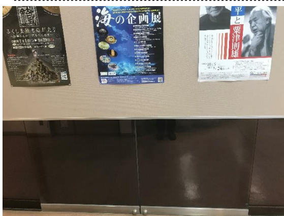
写真4. 使われない自動ドア.