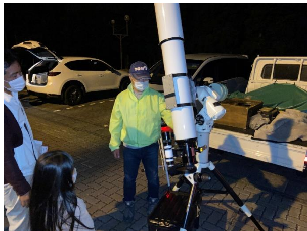
写真2. 第4回親子自然探訪教室「秋の星座を見つけよう！」の様子. 左：室内で桂会長より星空の観察方法を学ぶ様子. 右：屋外で天文同好会員から望遠鏡の説明を受ける様子.